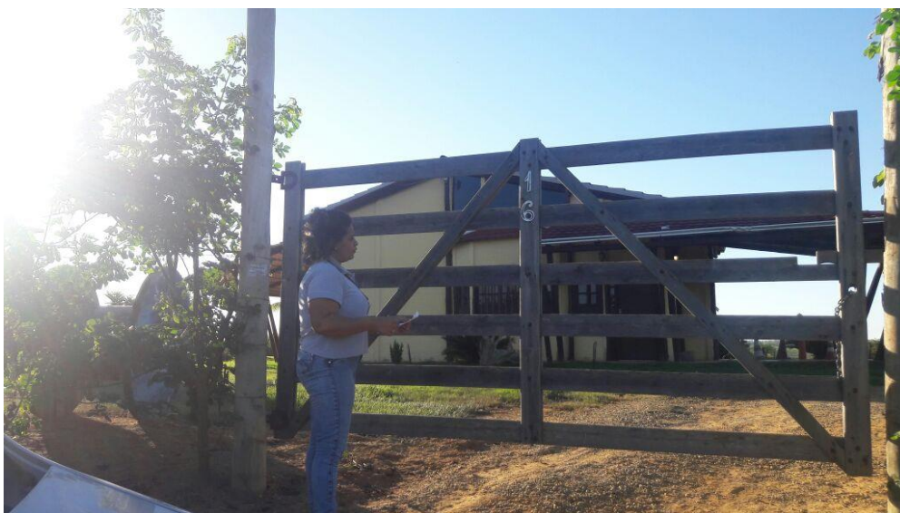
Figura 1. Registro fotográfico da visita.

No dia 09/06/2017, equipe técnica da empresa Synergia, enviou SMS para os números declarados pelo manifestante, com o objetivo que a família entre em contato com a empresa para realização do Cadastro Integrado.